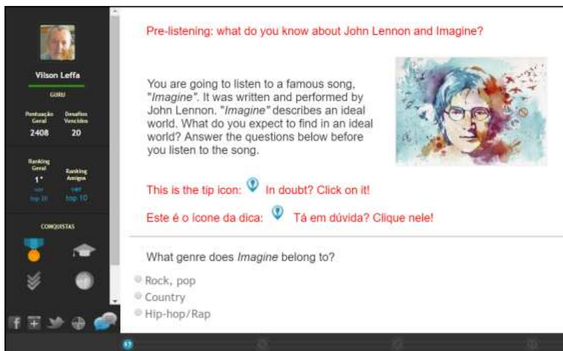
Figura 2 – Atividade gamificada